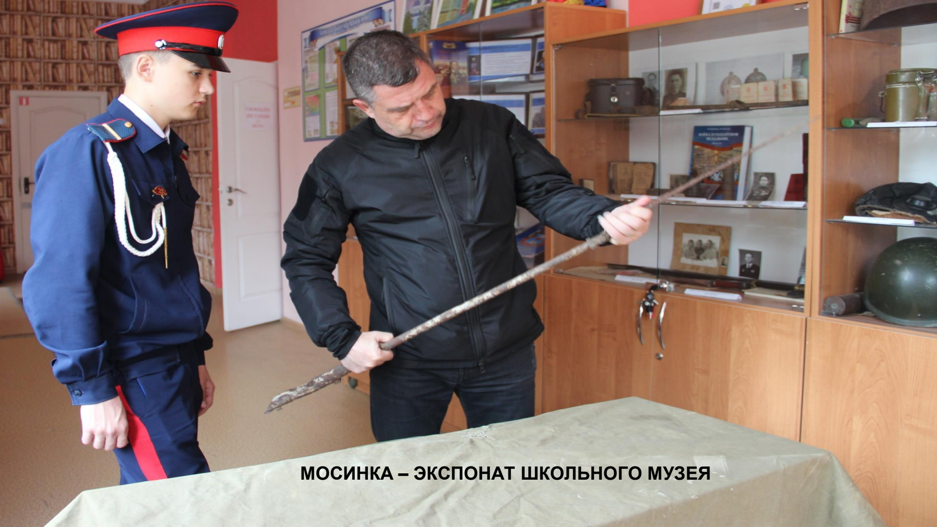
МОСИНКА – ЭКСПОНАТ ШКОЛЬНОГО МУЗЕЯ